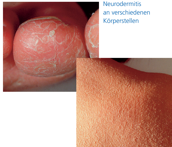
Neurodermitis an verschiedenen Körperstellen