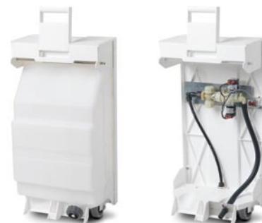
PH15/PH15A: mit fahrbarem Wassertank/Wasserfestanschluss