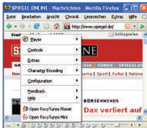
Foxytunes 2.9.5: Die Erweiterung integriert einen Musik-Player in den Firefox-Browser.

Auf meinem PC habe ich sehr viele Programme installiert. Wie behalte ich nun am besten den Überblick darüber, ob es für eine Applikation ein Sicherheits-Update gibt?