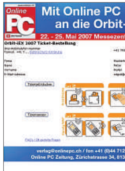
Schritt 2: Eintrittskarte ausdrucken,