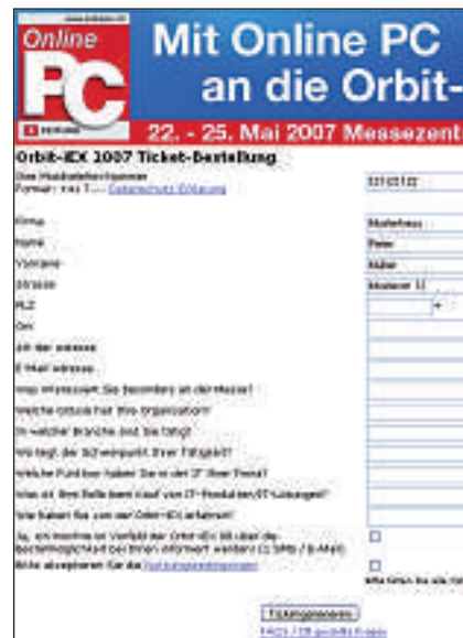
Schritt 1: Formular ausfüllen,

auf der neuen Seite die Möglichkeit das Ticket auszudrucken oder es sich an ein Handy senden zu lassen. Wenn Sie Ticket jetzt Drucken wählen, bekommen Sie eine druckfreundliche Version des Tickets, welches Sie nur noch ausdrucken, falten und zur Messe mitnehmen müssen – fertig. Auf zum Gratis-Ticket unter: www.onlinepc.ch .