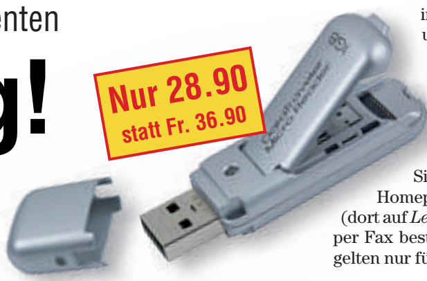
Tauscht Daten zwischen Handy und Computer aus: Data Traveler MR2.

Der Preis für Abonnenten: 288 Franken statt 448 Franken inklusive Versandkosten.