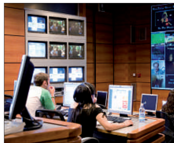
ADSL ermöglicht auch TV über die Telefonleitung.

Berücksichtigt sind die Gesamtkosten im ersten Jahr inkl. Monatsgebühren, einmalige Installationsgebühren, Zuschläge bei monatlicher Zahlung sowie Kauf des günstigsten Modems, sofern das Modem nicht kostenlos zur Verfügung gestellt wird. Promotionsangebote und Angebote von kleineren Anbietern sind nicht berücksichtigt. Neben Cablecom bieten zahlreiche, nur regional tätige Kabelnetzanbieter Breitband-Internet an. Voraussetzung für ADSL ist ein Festnetzanschluss (ab 25.25 Franken pro Monat) und für Kabel-Internet ein Analog-TV-Anschluss (bei Cablecom ab 26.45 Franken pro Monat). 1 Die Kosten von 30 Franken für Telefonanschluss und Inklusivminuten wurden herausgerechnet. 2 Preis gilt, wenn der Kunde über den gleichen Anbieter telefoniert. Stand: 15. April 2008