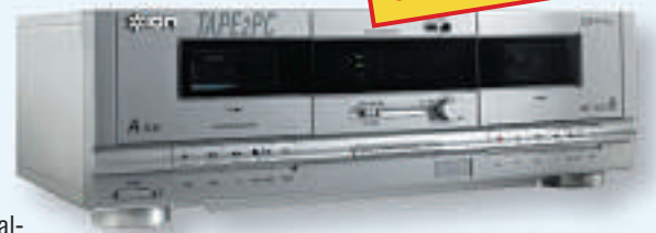
Überspielt Tonbandkassetten flott auf den Computer: ION Tape 2 PC.

Schnell online bestellen: www.onlinepc.ch unter Leserservice