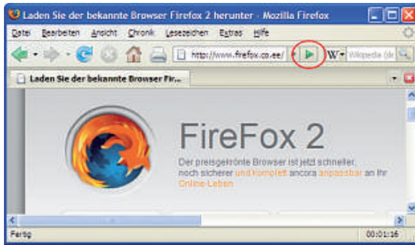
Navigations-Symboleiste: Der "Go"-Button zum Aufrufen der eingegebenen Internetadresse per Mausclick wird von den meisten Anwendern selten oder nie benutzt.

Die Pipelining-Funktion sorgt dafür, dass der Browser sämtliche Elementen