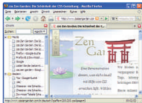
Chronik: In der Seitenleiste lässt sich ablesen, welche Webseiten Sie in den letzten Tagen besucht haben.

Sobald Sie etwas aus dem Internet herunterladen, startet Firefox den Download-Manager. Das stört insbesondere dann, wenn es sich nur um kleine Dateien handelt.