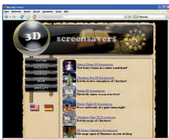
Riskante Seite: Die Screensaver auf dieser Webseite enthalten einen Trojaner.