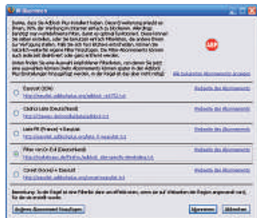
Adblock Plus: Mit einem Filterabonnement aktualisiert sich der mächtige Werbefilter automatisch.

So schützen Sie sich: Laden Sie neue Software nur von vertrauenswürdigen Quellen herunter. Bevor Sie ein neues Tool oder einen Screensaver installieren, sollten Sie ihn von Virustotal ( www.virustotal.com ) kostenlos prüfen lassen. Die Webseite checkt jede hochgeladene Software mit derzeit 32 unterschiedlichen Virenscannern. Die Chance, dass durch ein Schädling erkannt wird, ist viel höher als bei einem einzelnen Virens Scanner. Andreas Th. Fischer