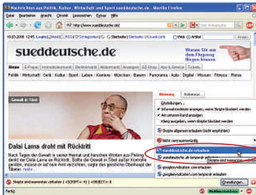
Firefox-Erweiterung Noscript 1.5.2: Das Add-on blockiert Javascript. Sie sollten diese Technik nur auf seriösen Seiten erlauben.

So schützen Sie sich: Surfen Sie nicht mehr mit dem Internet Explorer. Installieren Sie stattdessen Firefox 3.0 ( www.mozilla-europe.org , kostenlos). Dieser Browser führt keine riskanten ActiveX-Komponenten aus und wird zudem erheblich häufiger und vor allem schneller aktualisiert als der Internet Explorer.