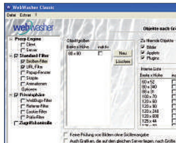
Webwasher Classic: Das kostenlose Tool filtert Banner zuverlässig anhand ihrer Abmessungen in Pixeln aus.

Diese und zahlreiche weitere Einstellungen nehmen Sie über den Menüpunkt Extras, CustomizeGoogle-Einstellungen vor. vh/sel