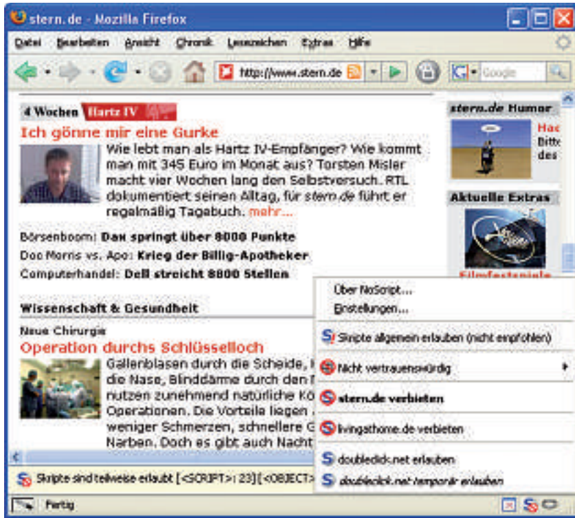
NoScript: Die Erweiterung blockiert Javascript und verhindert damit Pop-up-Fenster.

Banner lassen sich mit zwei Methoden ausschalten: Entweder filtern Sie die Grafiken anhand ihrer Grösse aus den Seiten heraus oder Sie identifizieren die Werbebilder über deren jeweilige URL.