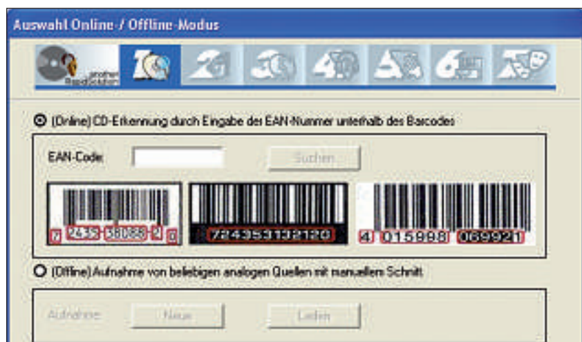
Uncdcopy 1.7.0.5 zerteilt und betitelt die Tracks einer Audio-CD automatisch.

Betriebssystem: Windows 2000/XP Sprache: Deutsch, Grösse: 7.4 MByte, www.heise.de/software , kostenlos