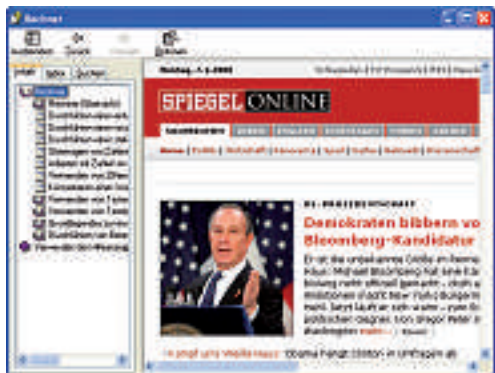
Über den Windows-Rechner surfen Sie, selbst wenn der Zugriff auf den Browser geblockt wird.

Die Webseite www.virustotal.com ist ideal, wenn Sie eine verdächtige Datei auf Schädlinge prüfen wollen. Virustotal analysiert jegliche Art von Malware, die von den Antivirus-Engines festgestellt wird. Alternativ zu dem Upload über die Webseite bietet Virustotal nun auch einen kostenlosen Uploader an, der sich direkt in den Windows-Explorer integriert.