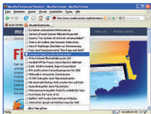
Schlagzeilen werden nun vollständig angezeigt.

Buttons haben nur zwei Optionen, welche die Einstellungen aktivieren oder deaktivieren.