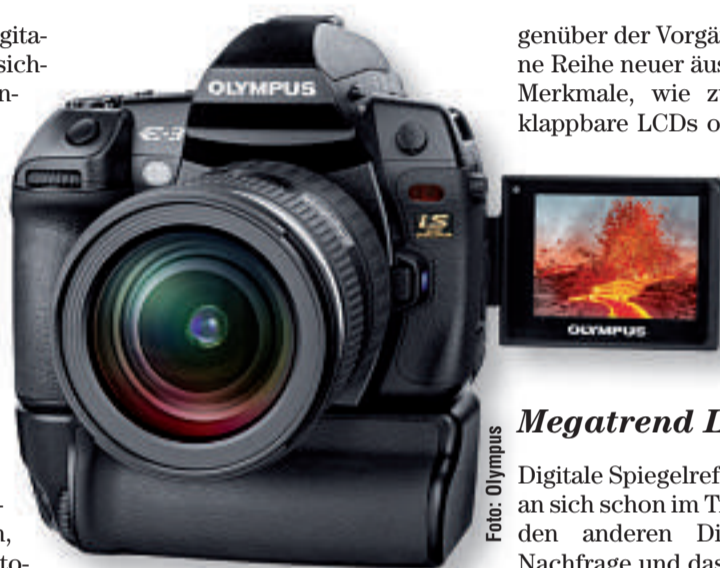
Die Ende 2007 eingeführte E-3 ist das robuste 10-MP-Topmodell von Olympus.

Genau genommen lässt sich eine DSLR wie ein modulares Werkzeugset mit unterschiedlichen Wechselobjektiven und diverser Zubehör (Aufsteckblitz, Hochformathandgriff etc.) für verschiedene Fotomotive und Arbeiten ausrüsten. Darüber hinaus stellen DSLR-Kameras dank spezialisierter Autofokus-Sensoren schnell scharf, schießen rasante Serienbilder und lösen nahezu verzögerungsfrei aus. Ihre grossen Fotosen-