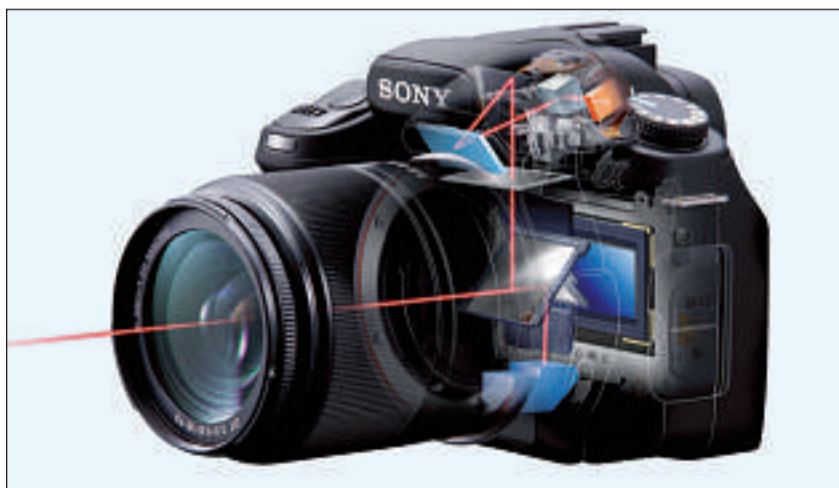
Das Licht wird bei jeder (D)SLR vom Spiegel hinauf in den Prismasucher gelenkt.

Wie schon bei Kompaktkameras sind auch die LCDs von DSLRs am Wachsen. Displays mit einer Bilddiagonale von 2.5"/6.4 cm sind heute üblich, neuste DSLRs trumpfen mit