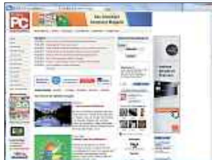
IE9: So sieht www.onlinepc.ch damit aus.

Nach einer erfolgreichen Lancierung der Beta-Version mit weltweit rund 40 Millionen Downloads ist jetzt die finale Version des Internet Explorer 9 da. Für Microsoft standen bei der Entwicklung die Nutzer und ihre Bedürfnisse im Vordergrund. ph www.microsoft.ch ; Webcode: 27671