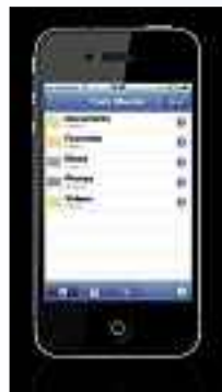
Wuala App: Alle Daten werden verschlüsselt. www.wuala.ch ; Webcode: 27672

Wuala, den sicheren Schweizer Online-Speicher, gibt es jetzt auch als iPhone- und iPod-touch-Applikation. Damit kann der Benutzer auch von unterwegs auf seine persönlichen Daten zugreifen. Wuala will laut eigenen Angaben den Bedürfnissen jener Benutzer gerecht werden, die hohen Wert auf Datenschutz und Privatsphäre legen: Im Unterschied zu anderen Online-Speichern werden Daten direkt auf dem Gerät (PC, Mobiltelefon) verschlüsselt. ph