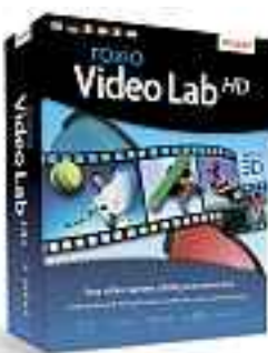
Video Lab HD: 3-D-Brille wird mitgeliefert.

Video Lab HD von Roxio bietet dem Benutzer alle Werkzeuge, die er für Projekte mit Profiqualität benötigt. Auch Anfänger erstellen damit laut Roxio hochwertige Produktionen zum Weitergeben und Ansehen auf YouTube, HDTV, iPhone oder iPad sowie zum Speichern im DVD-, AVCHD-, DivX- oder Blu-ray-Disc-Format.