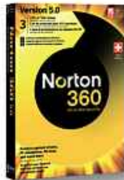
Norton 360 V5; OS: Windows XP, Vista und 7; Infos: www.norton.ch ; verfügbar ab: sofort; gesehen bei: www.atena.ch für 90 Franken (1 User, 3 PCs).

kümmern" erledigt Norton 360 fast alle Aufgaben automatisch im Hintergrund – erlaubt aber dennoch individuelle Einstellungen des Nutzers. Die neue, webbasierte Kindersicherung Norton Online Family ist einfach über die Oberfläche zugänglich. Die Sicherheitssoftware eignet sich gemäss Symantec auch gut für weniger leistungsstarke Netbooks. ph