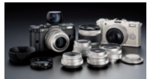
Pentax Q: mit eingebauter opto-magnetischer Shake-Reduction-Technik

Die kompakte Pentax Q ist eine neue Kamera im Zigarettenschachtelformat. Eine entscheidende Komponente des neuen Systems ist der neue CMOS-BSI-Sensor, der mit der Rückseite nach vorn eingebaut wird und so erheblich lichtempfindlicher reagieren soll als vergleichbare Systeme. Auf diese Weise erreicht der 12,4-Megapixel-Sensor Pentax zufolge eine bisher nicht gekannte Bildqualität und ein hohes Tempo. Die Bildfrequenz liegt laut Hersteller bei 5 Bildern pro Sekunde. Mit an Bord ist auch eine Full-HD-Videofunktion. In das Magnesium-Aluminiumgehäuse wurden die opto-magnetische Shake-Reduction-Technik und die Dust-Removal-II-Funktion des Herstellers integriert. Die