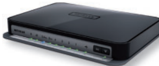
Netgear N750: unterstützt DLNA für das Streaming auf Endgeräte wie Fernseher und Blu-ray-Player

N750 agiert ebenfalls mit bis zu 300 MBit/s auf dem 2,4-GHz-Frequenzband und unterstützt auch den 802.11g-Standard. Der Dualband-Betrieb in einem drahtlosen Heimnetzwerk ermöglicht maximale Reichweiten und höchste Kapazitäten. Der Router bietet eine zentrale, flexible und zuverlässige Kindersicherung für alle Endgeräte im Netzwerk, eingeschlossen Windows PCs, Macs, Smartphones und Tablets. Kinder und Teenager erhalten mit Netgears Live Parental Control eine sichere Umgebung für Online-Aktivitäten. ph