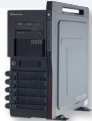
Gaming-PC: mit zwei USB- 3.0- und acht USB-2.0- Schnittstellen ausgestattet

Brack.ch bringt eine PC-Reihe für Spielernaturen auf den Markt. Die drei PCs der Serie Gaming sollen leistungsstarke Komponenten in einem auffälligen Gehäuse vereinen. Dank leistungsstarker CPU und moderner Grafikkarte deckt diese Serie die Bedürfnisse von anspruchsvollen Gamern ab. Die Systeme enthalten Intel-Prozessoren der Reihen i5 oder i7, eine Nvidia-Geforce-Grafikkarte und eine Festplatte von bis zu 2 TByte, die beim stärksten Modell ergänzt wird durch eine SSD mit 60 GByte Speicher. Alle drei Modelle sind mit Blu-ray-Player und DVD-Brenner ausgestattet. Auf allen Systemen ist das Betriebssystem Windows 7 Home