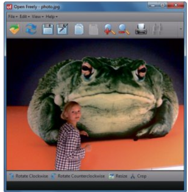
Flexible Oberfläche: Je nachdem, welches Format geladen ist – hier eine Tabelle und ein Bild –, stehen andere Bedienelemente zur Verfügung (Bild A)