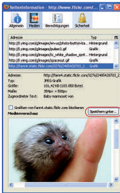
Geschützte Flickr-Fotos: Ein Trick speichert beliebige Bilder aus der Foto-Community Flickr auf Ihrem Rechner (Bild B).

Viele Webseiten versuchen, dem Anwender Abonnements oder bösartige Software unterzubeheln.