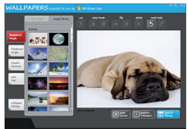
Windows Live Wallpapers: Das kostenlose Tool stellt über 60 Hintergrundbilder zur Verfügung und hat eine kleine Bildbearbeitung (Bild C).

Klicken Sie mit der rechten Maustaste auf eine freie Stelle der Taskleiste und wählen Sie unter XP und Vista Task-Manager . Unter Windows 7 wählen Sie Task-Manager starten .