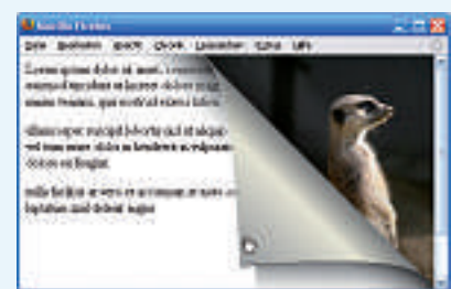
Eselsohren: Peel it 1.11 erzeugt diesen originellen Effekt.

Kopieren Sie alle Dateien mit den Endungen JS und SWF vom Ordner pagepeel auf den Webserver. Fügen Sie zudem eine