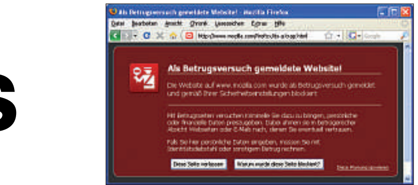
Phishing-Filter testen: Wenn Firefox einen solchen Warnhinweis anzeigt, dann funktioniert der Phishing-Filter.

Wenn Sie ein Stichwort in die Adresszeile eintippen und danach