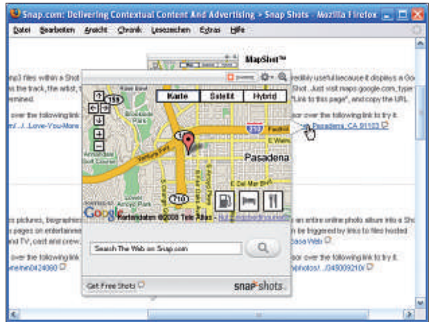
Interaktive Link-Vorschau: Bereits in der Vorschauansicht ist die Google-Maps-Karte voll navigierbar.

Um Snap Shots zu nutzen, melden Sie sich auf der Homepage des Dienstes über Get started in der Rubrik Publishers / Bloggers an. Wählen Sie ein Farbschema und die deutsche Sprachversion aus. Nach Eingabe eines Benutzernamens, eines Kennworts und Ihrer E-Mail-Adresse erhalten Sie Zugang zu einem Code-Baustein für Ihre Seiten.