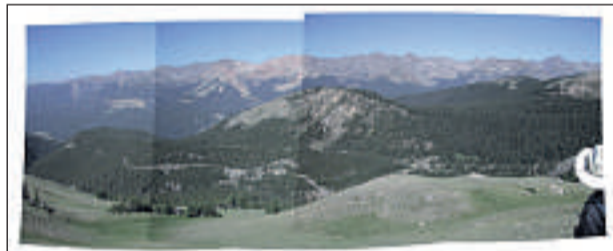
Enblend stimmt Farb- und Helligkeitswerte von Bildern ab.

Hersteller: Irfan Skiljan Sprache: Deutsch www.irfanview.com, kostenlos für Privatanwender