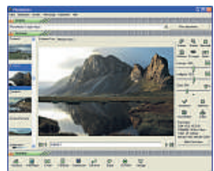
PhotoMeister 2.6 fasst Fotos in Alben zusammen und optimiert die Bilder.

Hersteller: Proxima Software Sprache: Englisch www.proximasoftware.com, kostenlos