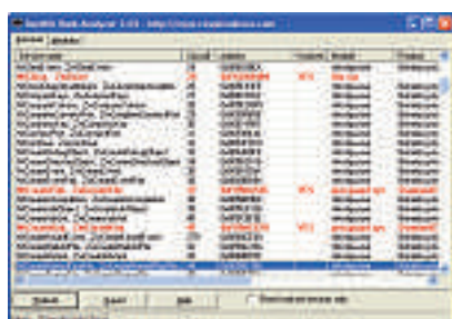
Rootkit Hook Analyzer 3.02: Verdächtig erscheinende Dienste sind rot markiert.

Bevor Sie jedoch etwas löschen, suchen Sie besser Rat in einem Expertenforum wie www.hijackthisforum.de .