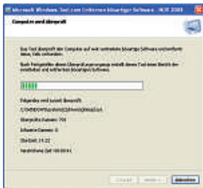
Das Tool zum Entfernen bösartiger Software 2.4 erkennt 120 Schadprogramme.

Böswillige Hacker greifen immer häufiger und gezielt private Webseiten an, etwa um dort illegale Dateien zu verstecken.