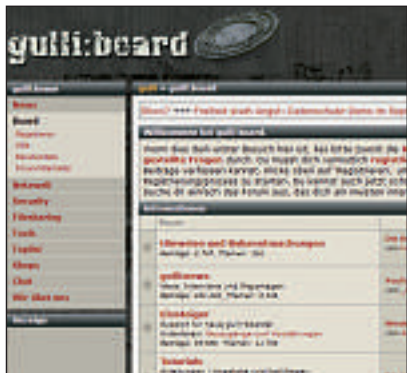
Forenregeln: Jedes Forum besitzt seine eigenen Regeln zum Verhalten.

Konkretisieren: Formulieren Sie Ihre Suchanfrage präzise. Beispiel: Ein Fehler tritt unter Windows XP auf und bezieht sich auf einen Scanner. Ein geeigneter Suchauftrag lautet in diesem Fall windows xp scanner fehler epson perfection 4490 . Auf diese Weise grenzen Sie die Anzahl möglicher Treffer erheblich ein.