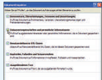
Word: Persönliche Informationen lassen sich bei Word 2007 nur über diese versteckte Option entfernen.

Umständlicher gestaltet sich das Entfernen persönlicher Informationen unter Word 2007. Hier müssen Sie bei jedem Dokument daran denken, die Informationen auszufiltern. Bevor Sie eine Word-Datei weitergeben, klicken Sie auf die Office-Schaltfläche, wählen Vorbereiten... , Dokument prüfen . Es öffnet sich das Fenster Dokumentinspektor . Hier stellen Sie sicher, dass die Option Dokumenteigen-