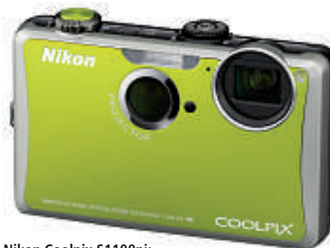
Nikon Coolpix S1100pj: Eingebauter Projektor.

Die Coolpix S1000pj war die welterste Kompaktkamera mit eingebautem Mini-Projektor. Und sie hat gezeigt, wie viel Spass es macht, Fotos und Movies überall im Grossformat gemeinsam geniessen zu können. Ihre Nachfolgerin, die Coolpix S1100pj, präsentiert sich jetzt noch leistungsfähiger. Der Projektor beamt rund 30 Prozent heller, die Bedienung erfolgt intuitiv über den berührungssensitiven, hochauflösenden 3-Zoll-Monitor. Neu beherrscht die Coolpix S1100pj auch HD-Movie-Aufnahmen und die Datenprojektion ab PC oder Mac – und wird so auch zur perfekten Businessbegleiterin. ph