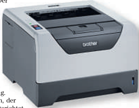
Druckt beidseitig in guter Qualität.

Die Installation ist einfach, der Duplexdruck schnell eingerichtet und der HL-5340D gibt fortan auf Wunsch beidseitig bedruckte Seiten aus. Die erste Seite liegt im Test nach 20 Sekunden in der Ablage, die Fol-geseite bereits nach 10 Sekunden.