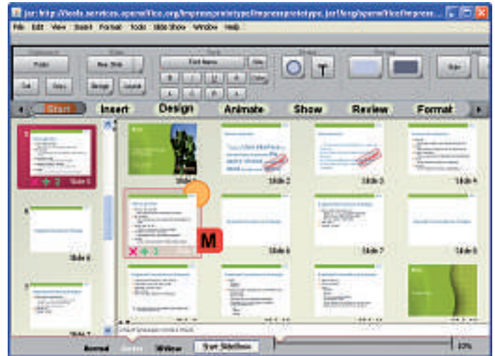
Die Zukunft von Open Office: So wird die Version 3.3 von Impress vermutlich aussehen. Ein Java-Applet zum Ausprobieren kann jeder herunterladen (Bild B).

Ein Java-Applet ermöglicht es jedem Interessenten, einen ersten Blick auf Renaissance