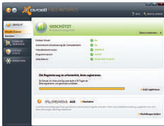
Alwil Avast Free Antivirus 5.0: Damit die Software den PC permanent schützt, muss der Nutzer sich online registrieren (Bild C).

PC Tools schränkt die kostenlose Version seiner Antiviren-Software stark ein. Anders als die Anwender des Kaufprogramms aus diesem Hause erhalten die Nutzer von PC Tools Anti-