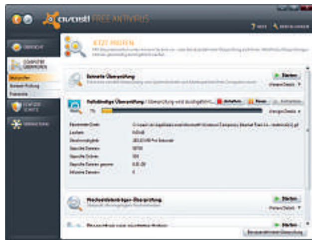
Schnellster Virenschanner: Avast Free Antivirus 5.0 scannt zwar sehr schnell, ignoriert aber gepackte ZIP- oder RAR-Archive (Bild B).

Wie Bitdefender Free Edition musste auch A-Squared von Emsi Software noch einmal in