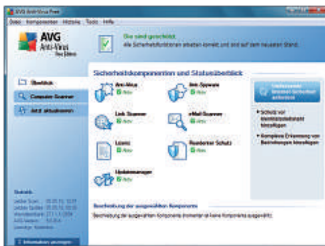
AVG Anti-Virus Free Edition 9.0: Die Bedienoberfläche ist übersichtlich gestaltet und gibt schnell Auskunft zum Schutzstatus des PCs (Bild D).

Die Scan-Ergebnisse waren im Test sogar besser als die der im vergangenen Jahr getesteten Version 9.0. Der Scanner ging flott zu Werke, obwohl sogar gepackte Dateien gescannt wurden. Ebenfalls gut: Der Hintergrundwächter bremste den Rechner kaum. Bei der Beseitigung aktiver Schädlinge blieb allerdings in einem Fall ein Schadprogramm samt Registry-Eintrag zurück. Insgesamt zeigte Avira die beste Sicherheitsleistung im Test. ▶